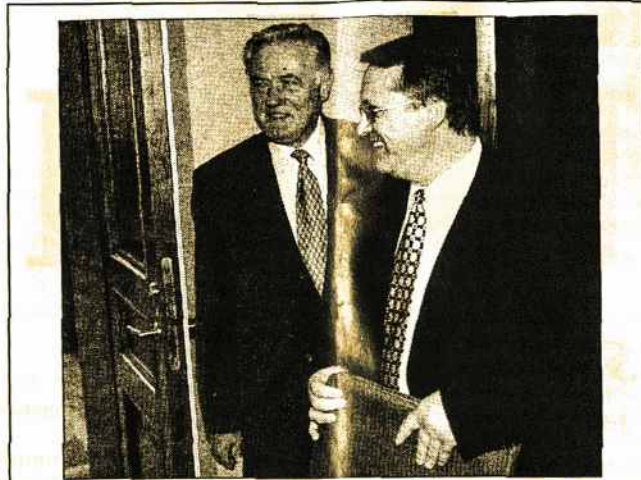
Prezidentas V.Adamkus ir Valstybės saugumo departamento generalinis direktorius M.Laurinkus aptarė buvusių slaptųjų KGB talkininkų likimą.