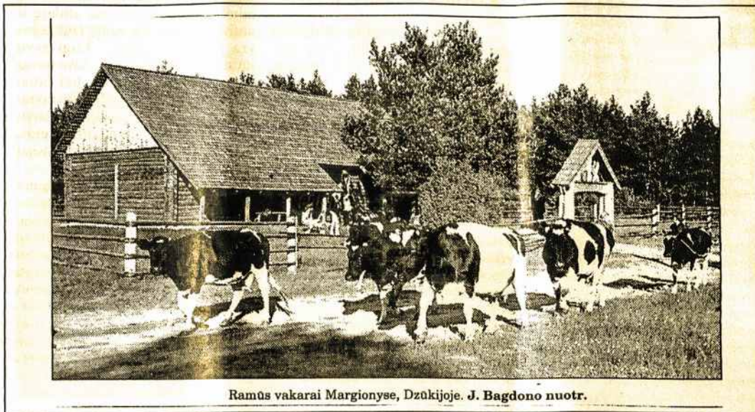
Ramūs vakarai Margionyse, Dzūkijoje.