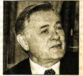
Prezidentas V.Adamkus yra įsitikinęs, kad gelbėjant gerą Lietuvos vardą dabar jau neužtenka vien tik vetuoti Seimo priimtą įstatymą.

"Konservatorių partijos pirmininkas nori mano pagalbos įstatymą pagerinant, jį patikslinant.