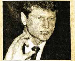
Šiauliuose R.Paksas prisiminė sutartį su „Williams“.