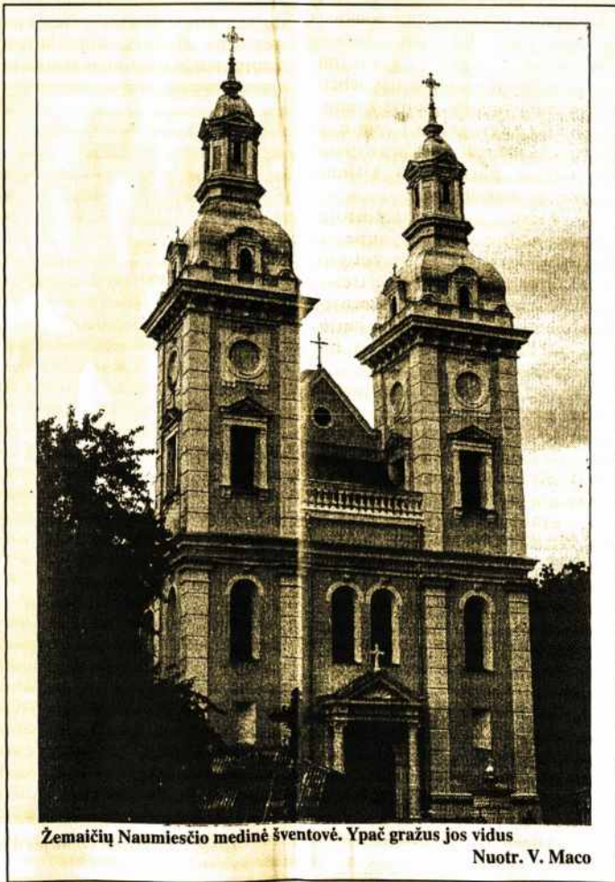
Zemaičių Naumiesčio medinė šventovė. Ypač gražus jos vidus