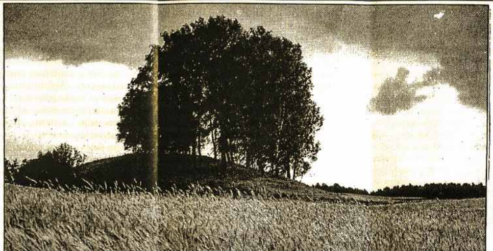
Ramus gamtovaizdis netoli Punsko.