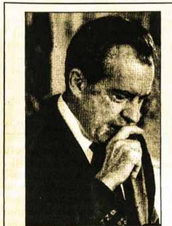
R.Nixono biografijoje teigiama, kad jis mušė savo žmoną ir vartojo svaiginamuosius vaistus.

Autorius cituoja žurnalistą Seymour Hersh, kuris tvirtina turįs įrodymų, kad kelios įstaigos yra užfiksavusios, jog ponias Nixon nuolat namuose patirdavo smurtą.