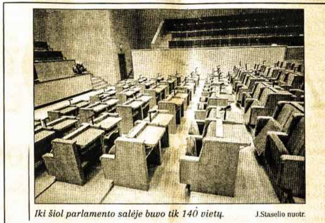
Iki šiol parlamento salėje buvo tik 140 vietų.