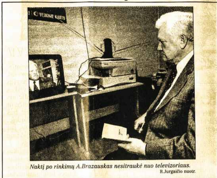
Naktį po rinkimų A. Brazauskas nesitraukė nuo televizoriaus.