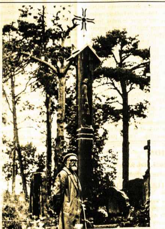
Skulptūra 1863 metų sukileliams ir jų vadui Povilui Červinskiui, Užpaliai, Utenos aps. 1984.