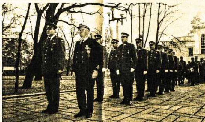
Kaunas - LŠS Visuotinis Suvažiavimas

* 1954 m. kovo 7 d. V.A. Mantauto iniciatyva Čikagoje atkurta Lietuvos šaulių sąjunga tremtyje. Išeivijoje šauliai puoselėjo tautiškumą, dalyvavo Lietuvos išlaisvinimo judėjime.