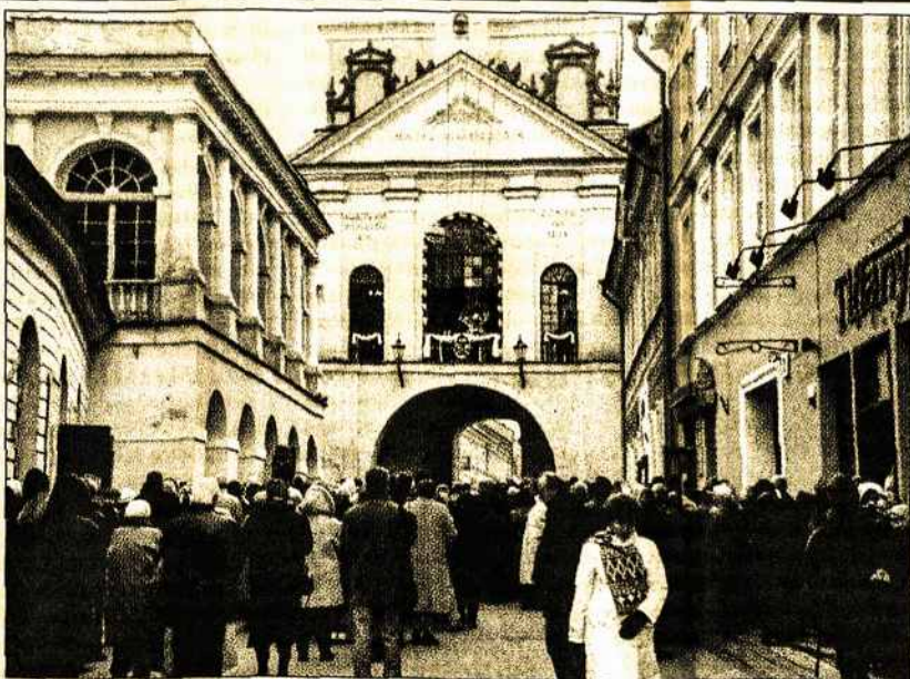
Prie Aušros vartų šventovės .