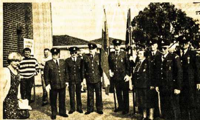
Melburno Šaulių būrys

Lietuvai. Autorė detalai analizuoja ne tik šių svarbų klausimų ateitį. Ji neatitolsta ir nuo Lietuvos santykių su Rusija, kurių klostymasis nulems abiejų šalių ateities bendradarbiavimo perspektyvas.