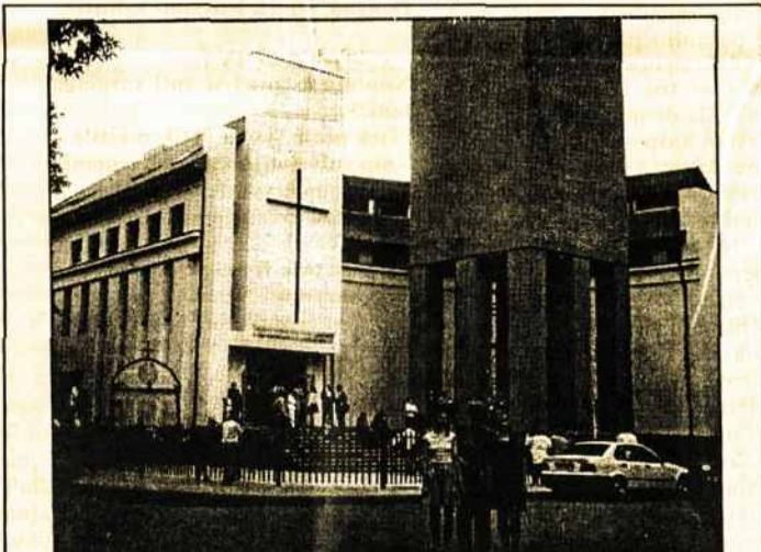
Tilžės katalikų šventovė su patalpomis kultūrinei veiklai ir atskiru bokštu. Tai naujas lietuvių gyvenimo židinytis Karaliaučiaus krašte

Po pasaulio lietuvių bendruomenės Seimo Vilniuje dalis jo dalyvių aplankė Tilžę