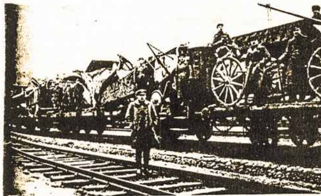
Radviliškio kautynių grobis Kauno geležink. stotyje