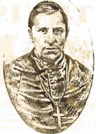
Vysk. M. Valančius

2001-ųjų metų vasario 16 d., sucina šimtas metų nuo vyskupo Motiejaus Valančiaus, vieno iš didžiųjų devynioliktojo šimtmečio Lietuvos asmenybių gimimo. Tamsiausiu ir tragiškiausiu Lietuvai metu, kai caro valdžia engė žmones, juos trėmė į Sibirą už lietuvišką žodį ir raštą, griovė bažnyčias, persekiojo tikinčiuosius, bruko slavizmą ir stačiatikybę, jis stovėjo darba bažnyčiai ir žmogui. Valančius ir jo įtakoje išauklėti jauni kunigai mokė žmones krikščioniškųjų vertybių ne valdžios-rusiška ar ponų-lenkiška, o kaimo valstiečių-lietuviška kalba. Tuo jis išreiškė pagarbą paprastam žmogui, jo kilmei, jo kultūrai, kalbėjo iš širdies į širdį, kėlė dvasią, gydė nuo širdies žaizdų ir nuo pragaištingų ipročių. Nenuostabu, kad jis susilaukė daugybės pasekėjų. Pastebėjęs, kad didžiausią nelaimę žmogaus gyvenime neša alkoholozmas, Valančius prie parapijų steigė Blaivystės Brolijas. Sutapatinęs blaivybę su krikščioniškais dorybėmis čia pritraukė daugiau kaip keturis penktadalius katalikiškosios krašto gyventojų dalies ir didelį skaičių kitatikybių. Valančius tapo švyturiu, kuris rodė kelią iš degradacijos ir alkoholio liūno į prasmingesnį, vertingesnį ir laimesnį gyvenimą. Žmonės atgavo savigarbą, pasitikėjimą, viltį. O kai akys pamato geresnį rytojų kojos randa kelią, rankos pakelia našta. Pakilę žmonių dvasinė būklė, kultūrinis lygis ir tautinis susipratimas eventualiai atvedė tautą į savarankišką nepriklausomą gyvenimą tapo akstinu Lietuvos valstybingumo atkūrimui.