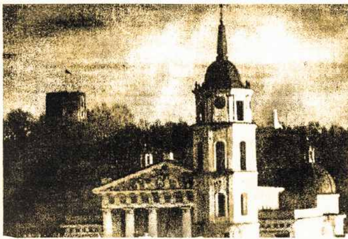
Vilniaus katedra su varpine, dešinėje matosi šv. Kazimiero koplyčios kupolas. Kairėje - Gedimino kalnas.