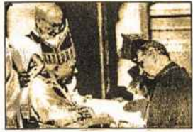
Popiežius Jonas Paulius II palaimino Vilniaus arkivyskupą A.J.Bačkį