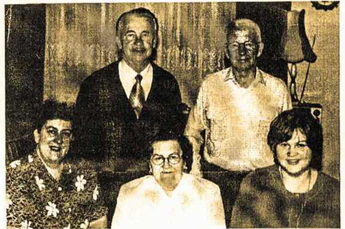
Dosniausia organizacija Geelonge, 12-kos mėnesių laikotarpyje parėmė lietuviškas organizacijas sumoje 3800 dol.