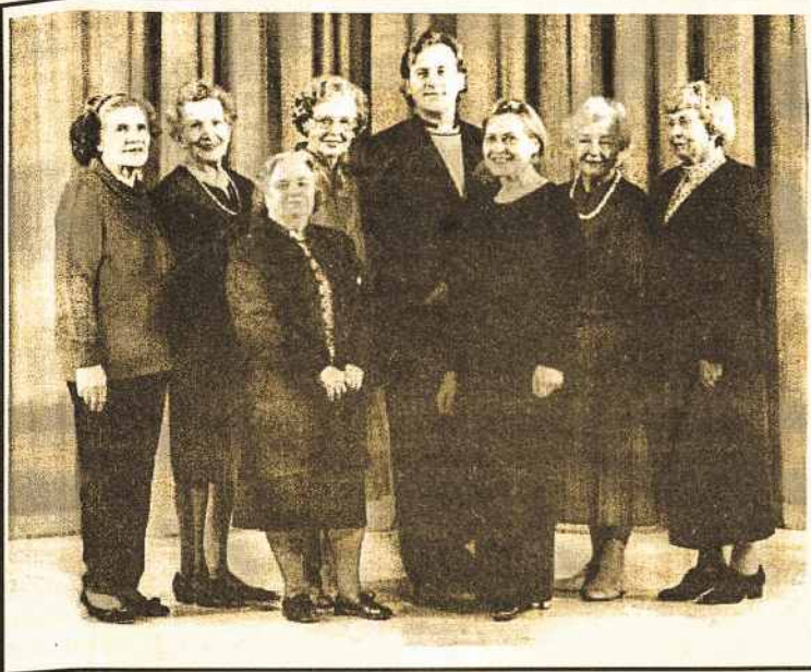
M.L.K.M.D. VALDYBA 2001 m. rugpjūčio mėn. 18 d.