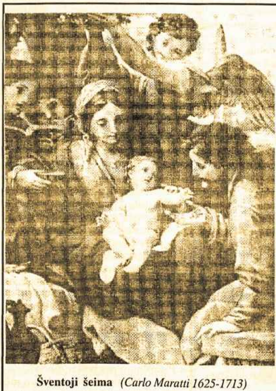
Šventoji šeima (Carlo Maratti 1625-1713)

susiliečia dangus ir žemė. Jie nusprendė vykti į kelionę tos vietos ieškoti ir negrįžti tol, kol jos nesuras.