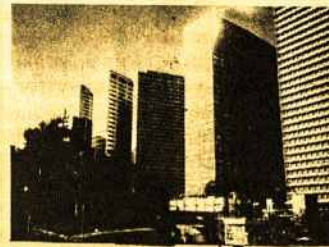
Rio prekybos centras

Pats miestas buvo įkurtas portugalų 1501 metais. Galvodami, kad šita vieta buvo prie upės žiočių, ją pavadino Rio de Janeiro. Po kelių susidurimų su prancūzais, pirkliais ir naujakuriais, kolonija pasiliko