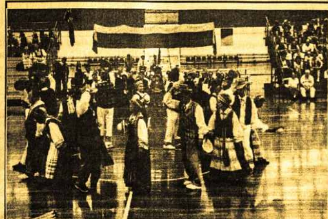
XXII Australijos Lietuvių Dienų Atidaryme, Adelaidėje, 2002.12.27, šoka Adelaidės tautinių šokių grupė Branda "Kepurinė".