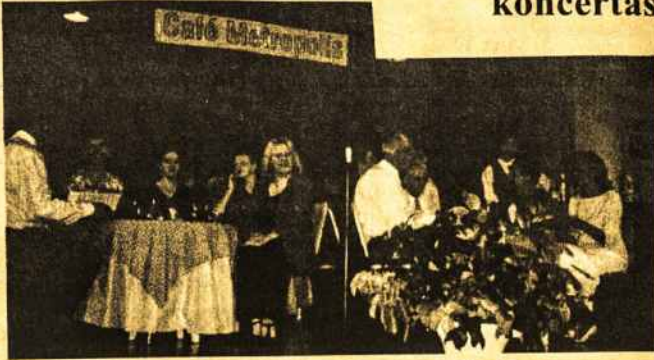
Sceninis vaizdas iš “Café Metropolitan”