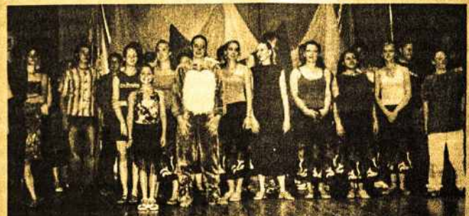
XXII ALD Jaunimo koncerto dalyviai

Geelongo “Gegutės” šokių ansamblis, choreografija B. (Nukelta į 5-tą psl.)