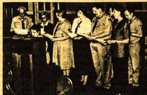
Skautininkai gieda šv. Mišiose.