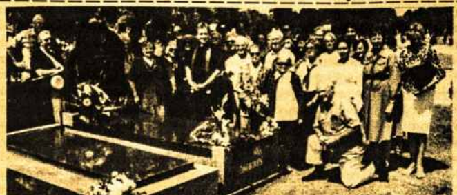
Fawkner kapinėse prie prel. Dauknio kapo.