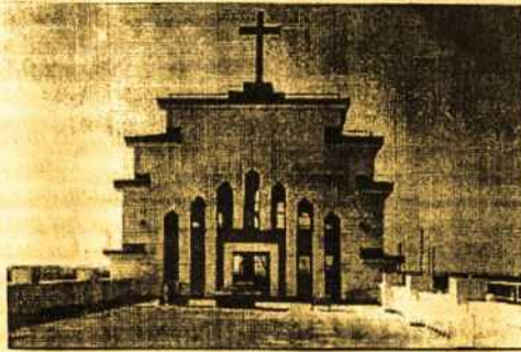
Ant Prisikėlimo šventovės (Kaune) stogo terasos koplyčia žuvusiems kovose už Lietuvos laisvę.

dalis ir kita. Iki 2001 m. pabaigos atliktų darbų apimtis jau viršijo 7 mln. Lt., iš kurių 3.5 mln. Lt. skyrė valstybė, kitą dalį sudaro žmonių aukos.