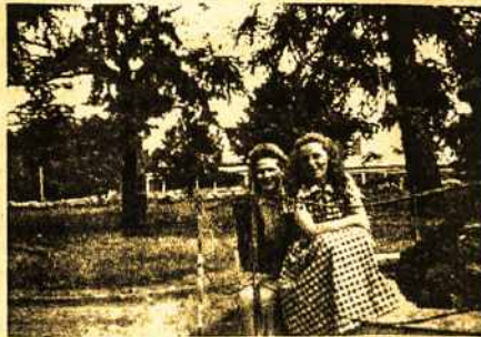
Ale su drauge ligoninės kieme

kai aš išgirdau tankius, sunkius žingsnius artėjant koridoriui. Raktas sugirgždėjo spygoje ir į vidų įėjo palatos sesuo. Jos pažastys buvo išprakaitavę ir atrodė įkaitus ir pavargus, kaip ir mes visos. Ji irgi yra žmogiška nežiūrint jos aštraus elgesio, dingtelėjo man į galvą.