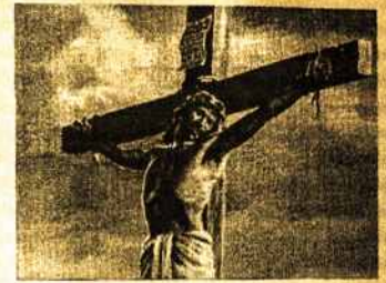
Manoma, kad Jėzus Kristus buvo nukryžiuotas 33 metų bal. 3-įją.

Astronominiai duomenys apie 26-35 mūsų eros metais buvusią žvaigždžių padėtį ir Mėnulio fazes rodo, kad per tuos devynerius metus