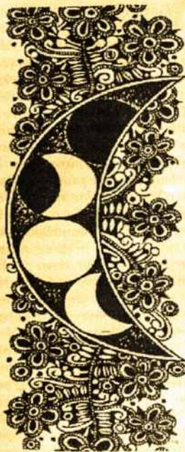
Zitos Stonienės braižinys

juokaujant, jos šaltas manęs priėmimas pradėjo pamaži atšilti. Atėjus laikui atsiveikinti, tikėjau, kad man pasisekė užmegsti santykius su jomis ir kad jos į mane daugiau nebekreivos.