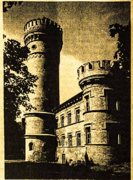
Raudonės pils, XVI-XVII a. Jurbarko raj. The castle of Raudonė, 16 th -17 th c. Jurbarkas region