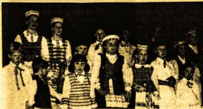
Melbourno Motinos Dienos dalyviai

Čia, Kvinslende, man nustatyta atidirbti du metus, po to būsiu laisvas gyventi, kur noriu. Darbas nėra toks sunkus, bet reikia