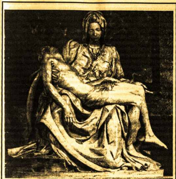
PIETA – Michelangelo Buonarroti

Būtent toji tiesa: Jėzus sukūrė savo Motiną tokią, kokios pats norėjo.