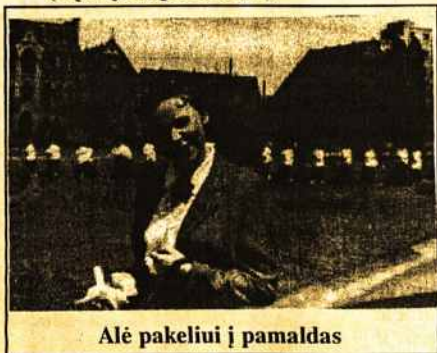
Alė pakeliui į pamaldas