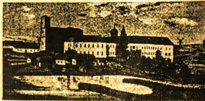
Kražių kolegijos rūmai ir jėzuitų bažnyčia (XIX a. viduryje)

Turbūt reta Lietuvos vietovė turi tokią turtingą ir dramatišką istoriją kaip Kražiai