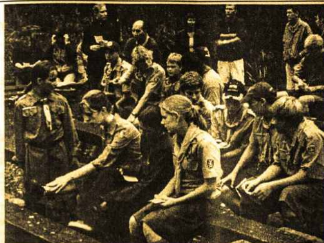
Iš Lietuviškų tradicijų stovyklos - susikaupimo akimirka prieš šv. Mišias.

Australijos Lietuvių Katalikų Federacijos valdyba