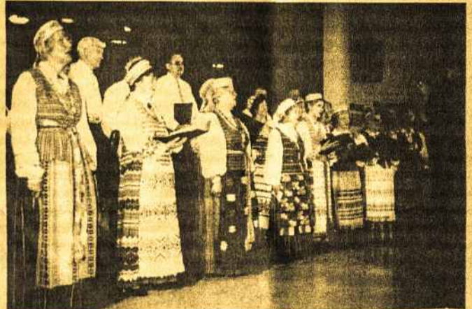
Scenoje Melbournu "Dainos Sambūris"