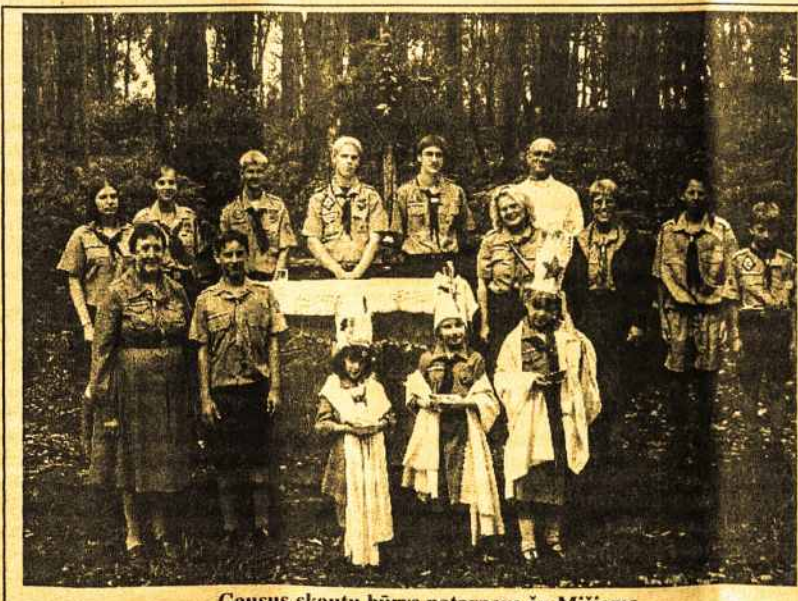
Gausus skautų būrys patarnavę šv. Mišioms

Stovyklauti smagu ir sveika, ypač jaunesniems. Skautiškas ačiū visiems!