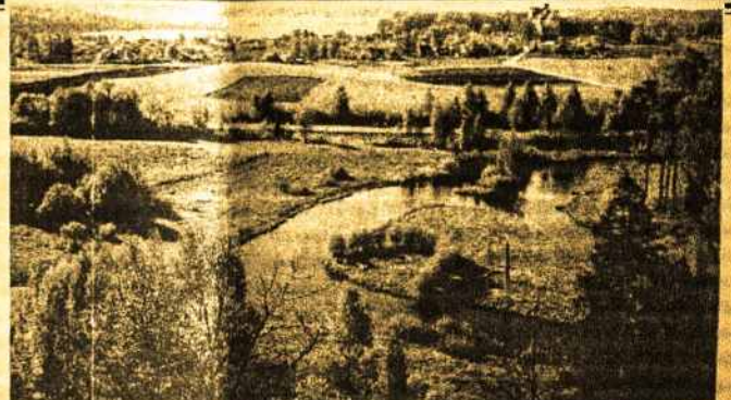
Lietuvškas kaimo vaizdelis

Prenumeratos kaina metams Australijoje $45 dol., Europoje ir Amerikoje paprastu ir oro paštu $90 Aust. dolerių. Atskiras numeris $1-50. Skelbimai už skilties vieną cm. $3. Nuolatiniam skelbėjams daroma nuolaida. Už skelbimų ir pasirašytų straipsnių turinį neatsakome. Redakcija korespondencijas trumpina ir taiso savo nuožiūra.