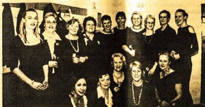
Linksmos Vyresnės skautės po koncerto.