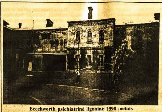
Beechworth psichiatrinė ligininė 1998 metais