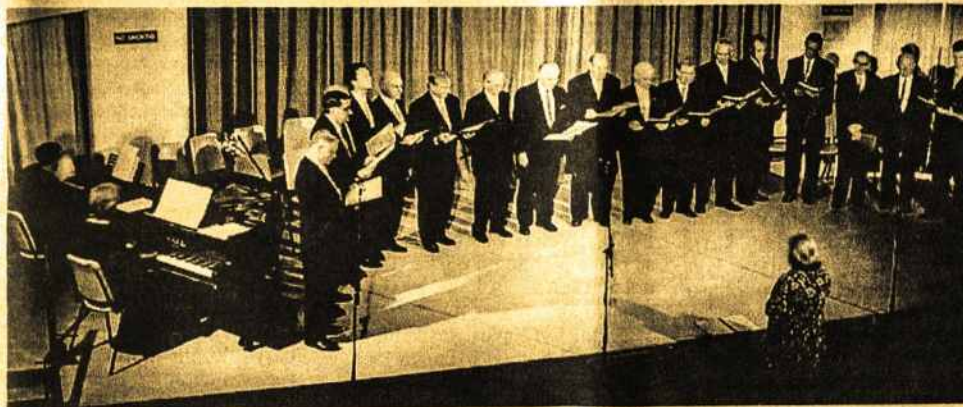
"Danos vyrai" koncerto metu.

Po choro pristatymo drąsiai, kaip vyrams pridera, suskambo V. Kuprevičiaus aranžuota R. Babickio daina "Mes žengiam".