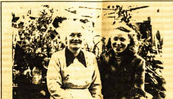
Alē su Forelady