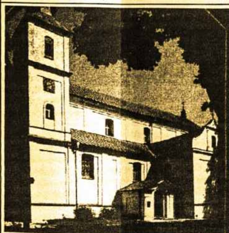
Šv. Petro ir Pauliaus bažnyčia, Varniuose XVI-XVII a.

persekiojo nekaltus žmones, įkalindavo juos ir netgi pasmerkdamas