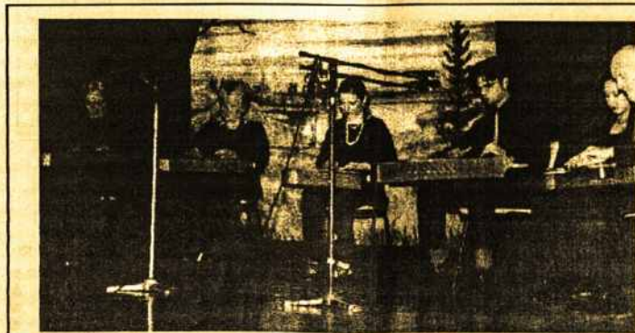
Dalis Melbourne Kanklių ansamblio