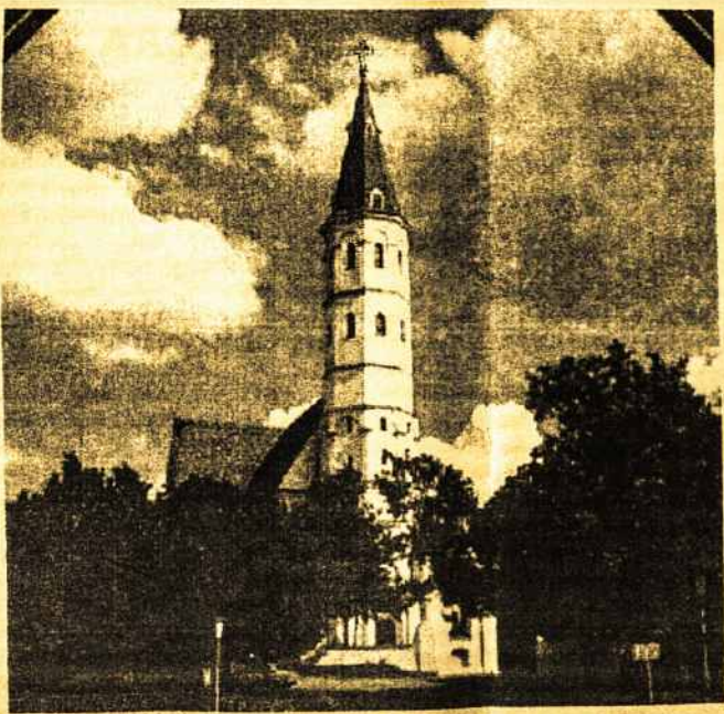
Šv. Petro ir Povilo bažnyčia, Šiauliuose - 1595-1625 m.

Vienas dalykas bendras tiek Petriui, tiek Pauliui - jie abu nėra kokie nors antžmogiai. Abiem teko sunkiai suklysti. Petras išdavė savo geriausią draugą ir Viešpatį, palikdamas jį ir (Nukelta į 2-trą psl.)