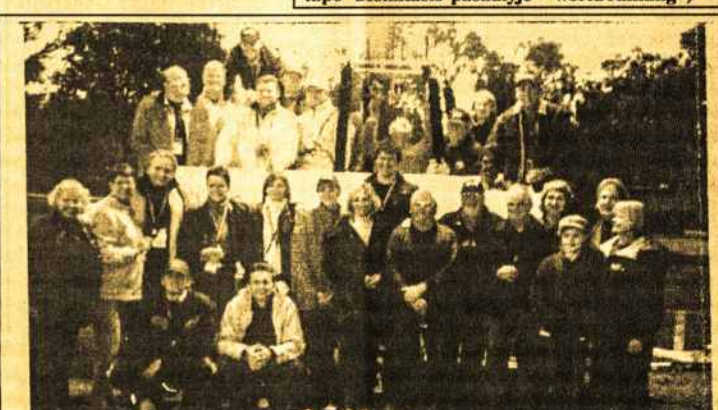
Visos trys komandos iš Lietuvos pabendravo su sirgaliais iš Canberros ir Melbourn. Prie Murray upės oreiviai pirmą kartą valgė kengurienos.