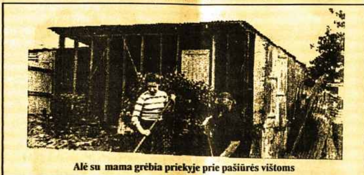
Alė su mama grėbia priekyje prie pasiūrės vištoms