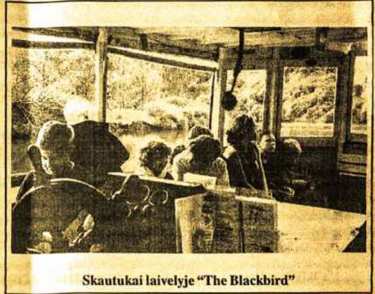
Skautukai laivelyje "The Blackbird"

Šiais metais rugsėjo 28-tą dieną, Melbourne skautės, skautai, p a u k š t y t ė s, vilkiukai ir vienas gintarėlis plaukė laivu – ekskursija Maribyrrnong upe. Išplaukė iš Footscray ir plaukė apie 2 val. Laivo kapitonas visą kelią aiškino ir pasakojo apie įdomias vietas.