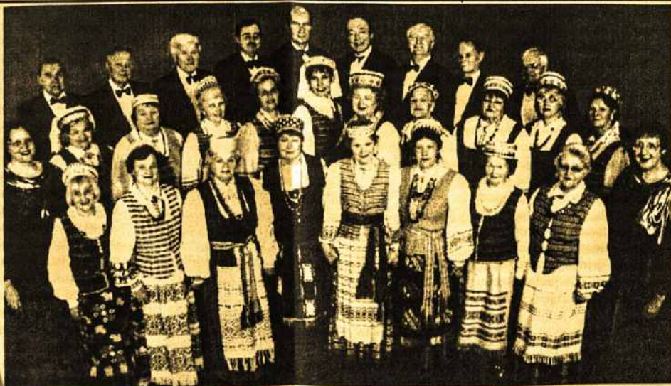
Melbourno „Dainos Sambūris“ 2004 m.

Po koncerto bus kavutė. Bilietai $15 – jaunimas žemiau 15 metų veltui. Laukiame visų! Choro valdyba