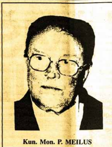
Kun. Mon. P. MEILUS

Skaudi patirtis rodo, kad sunkiai susirgus nekviečiamas