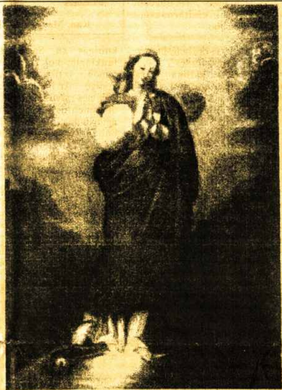
Lacrima paveikslas - iš "Švč. Mergelės Marijos litanija"