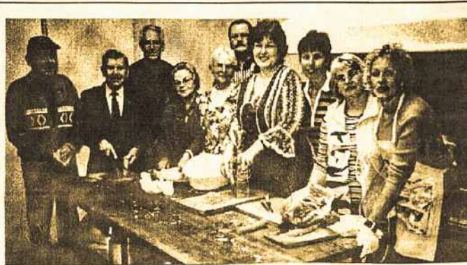
ALK Federacijos Valdybos nariai su pagalbininkais verda pietus Lietuvių Namuose surinkti lėšų "Tėviškės Aidams".