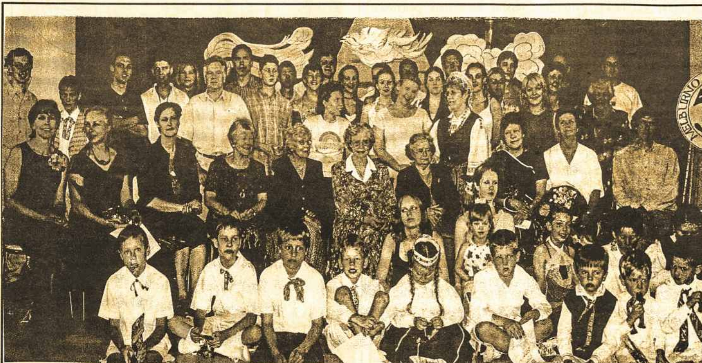
Dalis 2004 m. Melburno Lietuvių Mokyklos esamieji ir buvsieji mokytojai ir mokiniai.