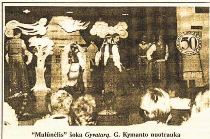
"Malūnėlis" šoka Gyvatarę.