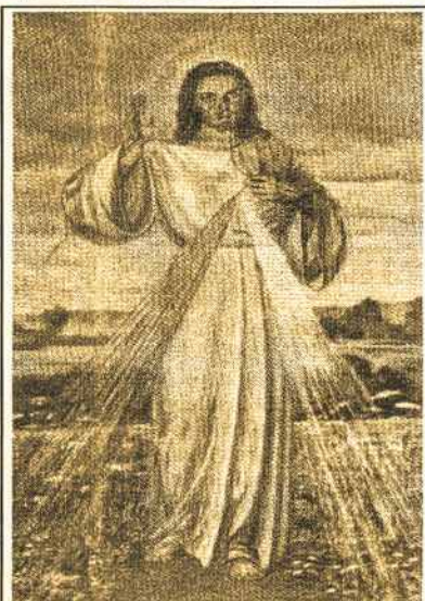
"Jėzau, Tavyje aš pasitikiu" "Jesus, I trust in Thee"

Pirmajame skaitinyje iš Pradžios knygos pasakojama apie Abraomo susitikimą su slėpininguoju Salemo karaliumi ir kunigu Melchizedeku. Jo atnešose duonos ir vyno atnašose krikščioniškoji tradicija įžvelgia eucharistinės aukos provaizdį. Apaštalo Pauliaus tekstas Pirmajame laiške korintiečiams yra seniausias pasakojimas apie Eucharistijos įsteigimą. Evangelijoje pasakojama apie duonos padauginimą - tai šlovingojo Kristaus Kūno padauginimo eucharistinėje duonoje provaizdis. Iš konteksto galima spręsti, kad