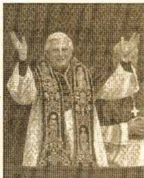
Popiežius Benediktas XVI

Kalba, pasakyta birželio 6 d., Romos šv. Jono Laterano bazilikoje, pradėdant Romos vyskupijos bažnytinį kongresą "Šeima ir krikščionių bendruomenė: asmens ugdymas ir tikėjimo perteikimas"