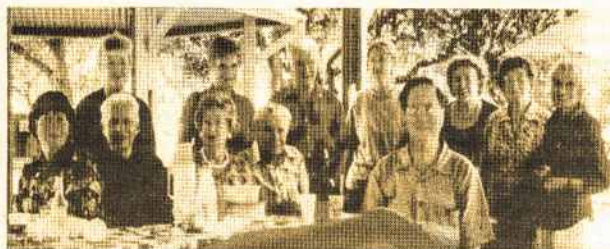
Annual General Meeting at Cascade Gardens

He celebrated his 80 th Birthday in April at a party in the