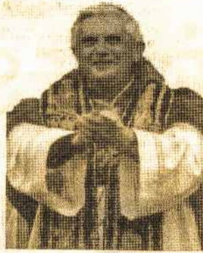
Popiežius Benediktas XVI

Iš viso to išplaukia aiškus padarinys: šeima ir Bažnyčia, konkrečiai, parapijos ir kitos bažnytinės bendruomenės formos, pašauktos artimiausiai bendradarbiauti, vykdamt pamatinę užduotį, kurią sudaro - vienas nuo kito neatskirtini - asmens ugdymas ir tikėjimo perteikimas. Gerai