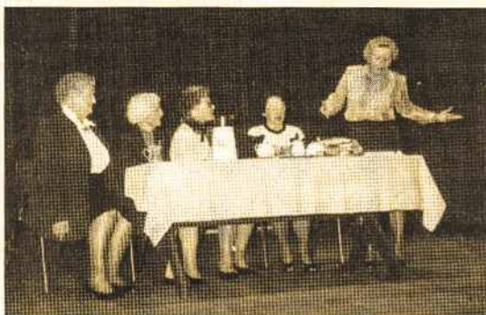
„Kavutė“, kur vaidina visa Katalikių Moterų Draugijos valdyba.