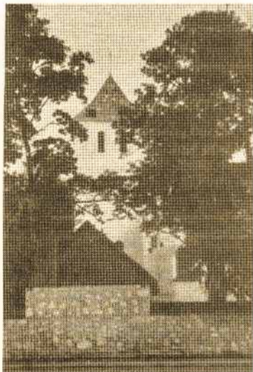
Naujosios Žagarės bažnyčia