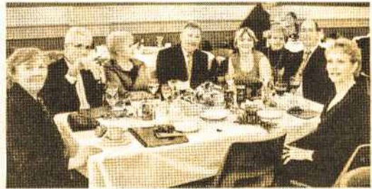
Dalis melbourniečių linksminasi prie suomių suruoštų vaišių

esamus išnuomojamus kambarius, o ir savo viso turto pertvarkymas užėmė daug laiko.