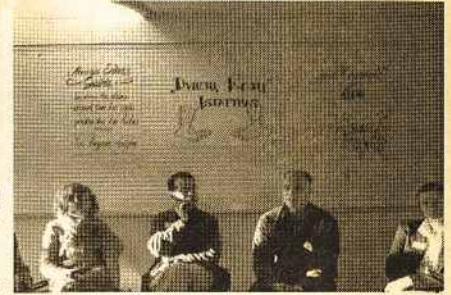
Dalis Vokietijos lietuvių bendruomenės darbuotojų suvažiavimo metu