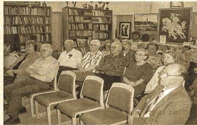
Dalis Kariuomenės šventės minėjimo dalyvių Canberros būstinėje

valdybos narius ir jų antrąsias puses, vidurinėsios kartos, kurių yra nemažas skaičius, nesimatė. Tikriausiai juos matysime Kalėdų pobūvio pietuose.