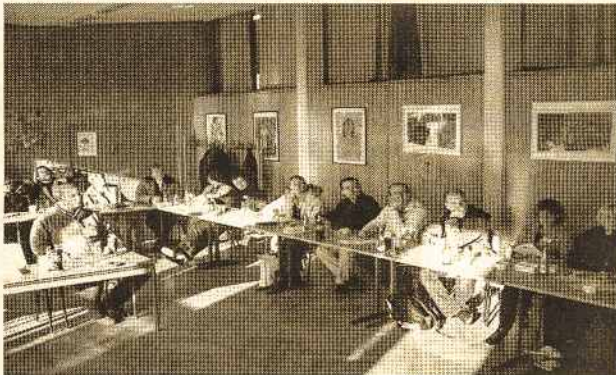
Suvažiavimo diskusijos metu

Atsižvelgiant į tai matyti, kad instituto veikla aktuali išliks ir ateityje. Todėl ypač svarbu užtikrinti materialinį pagrindą, nes didėjančios LKI paslaugų paklausa ir išsiplėtusio darbo lauko nebegalima aprėpti savanoriška kultūrine veikla.