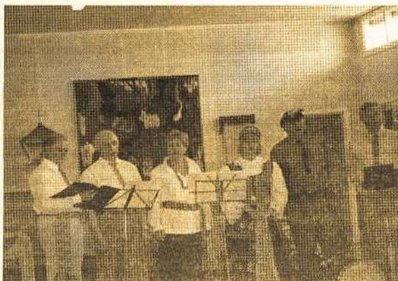
Melbourne "Kaimas" dainininkai