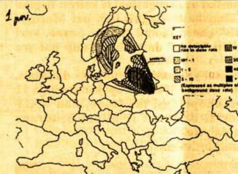
FIG. 2 RADIATION DISPERSION PATTERN ACROSS EUROPE 29 APRIL 1986

Tik po 1990 metų rinkimų, kai į Aukščiausiąją Tarybą pateko 4 žalieji, buvo pradėta rūpintis Černobylio avarijos pasekmėmis ir jau esamomis aukomis: sudarytas užtersimo žemėlapis, iškovotas tarptautinis pripažinimas, kad nukentėjo (be Rusijos, Baltarusijos ir Ukrainos) ir kitos šalys. Tuo pačiu ir gauta parama - 1 milijardas eurių (5 milijardai litų) Lietuvai ir po 0,5 milijardo eurių Latvijai ir Estijai, kaip perpus mažiau nuspinduliuotai. Kur dingio ši Europos parama galėtų smulkiau paaiškinti ekspremjeras G. Vagnorius, nes jokių dotacijų negavo Sveikatos apsaugos ar aplinkos apsaugos ministerijos, jokių kompensacijų negavo 7000 Černobylio avarijos likvidatoriai, nei specialūs centrai. Tačiau labai įtartina atrodo G. Vagnoriaus gyrimas, kad jo Vyriausybė vienintelė nepalikto Lietuvai skolų?