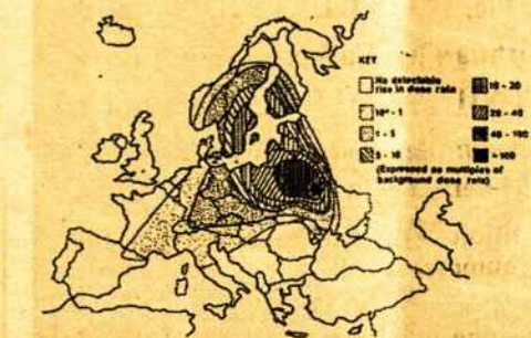
FIG. 3 RADIATION DISPERSION PATTERN ACROSS EUROPE 30 APRIL 1986

1 paveikslas: Radiacijos užtersimas Europoje 1986 m. balandžio 29-30 metu.