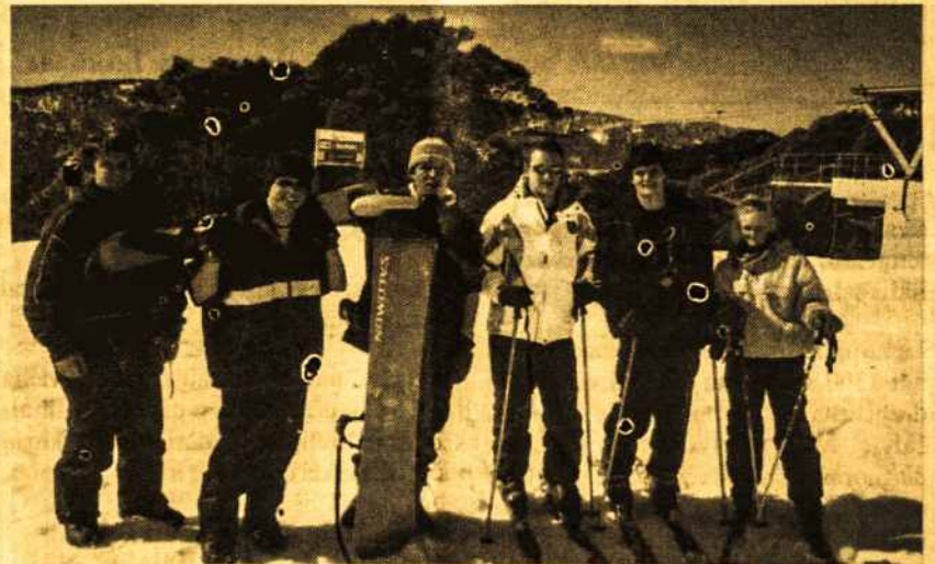
Rugpjūčio pabaigoje Melburno jaunimas turėjo savaitgalį Falls Creek. Sniego buvo daug, todėl visi buvo patenkinti kelione.