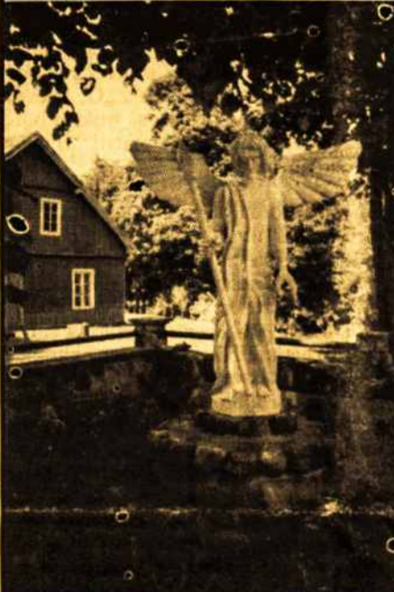
Rugsėjo 29 d. švenčiame šv. Mykolo arkangelo Dievo pasiuntinio dieną.

Taip, tai iš tiesų problema: ar mes tikrai taip akcentuojame moralę? Sakytai - ir tu vis labiau įsitikinu kalbėdamasis su Afrikos vyskupais - kad pagrindinė problema, jei norime pažangos šioje srityje, yra švietimas, formacija. Pažanga gali būti tikra pažanga, jei ji tarnauja žmogaus asmeniui, jei bręsta žmogaus asmuo, didėja ne tik jo techninė galia, bet taip pat jo moralinis pajėgumas. Manau, kad tikroji mūsų dabartinės istorinės situacijos problema yra pusiausvyros nebuvimas tarp nepaprastai spartaus mūsų techninės galios augimo ir proporcingai nedidėjančio moralinio pajėgumo. Dėl to, žmogaus asmens formavimas yra tikrasis receptas, yra raktas viskam, ir tai yra taip pat ir mūsų pasirinktas kelias. O formacija - trumpai tariant - turi dvi dimensijas. Visų pirma, žinoma, turime mokytis, įgyti naujų žinių ir sugebėjimų, įgyti, kaip sakoma, „know-how“. Šia linkme Europa, o pastaraisiais dešimtmečiais ir Amerika, labai daug nuveikė ir tai labai svarbu. Tačiau jei plinta tik „know-how“, mokoma tik gaminti mašinas ir jomis naudotis, naudojamos tik kontraceptinės priemonės, tai nereikia stebėtis, kad galiausiai matome karus ir AIDS epidemijas. Mums būtinos dvi dimensijos: tuo pat metu reikia formuoti ir širdį, kuria žmogaus asmuo įsisavina