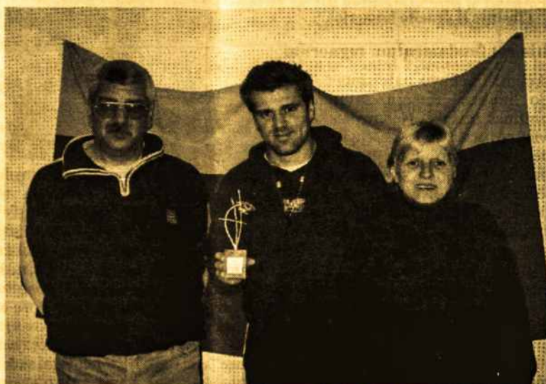
Radijo programos laimėtojai

Lietuviškai radijo programai „Ecos de Lituania“ („Lietuvos aidai“) rugpjūčio mėnesio 4 d. Chaco provincijoje, Resistencia mieste buvo įteikta „Dorada“ („Dorado“) premija už geriausią 2005-2006 m. Argentinos radijo programą kitataučių bendruomenių kategorijoje.