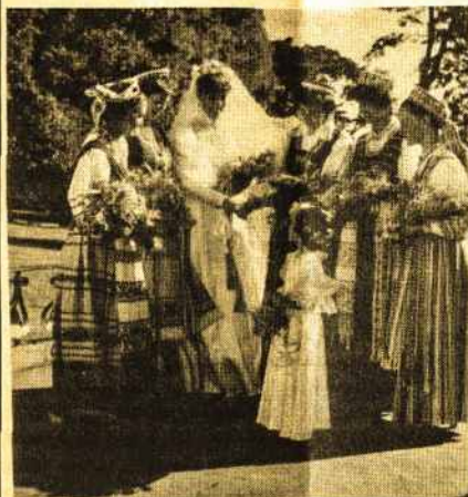
Lietuviškos Birutės vestuvės, 1984 m

Fotografijose užfiksuojame įsimintinas gyvenimo akimirkas, išsaugome brangius žmones ir vaizdus. Kadre sustabdę akimirką, rašome istoriją- savo, šeimos, miesto, šalies. Lietuviai yra išsibarstę po visą pasaulį, su Tėvyne juos sieja tapatybė, tradicijos.