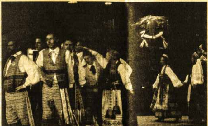
"Atžalynas" koncerto metu, Melbourn Lietuvių Namuose