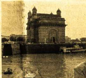
Indijos vartai Mumbai

Čionykščiai pripratę prie tokio apsigėmimo ir nesistebi matydami nuogus pilvus, kuriuose matosi įverti auskarai arba šlaunys ar rankos išstatuotai įvairiais piešinukais. Šis Indijos kampelis labai panašus į civilizuotą kraštą. Mat šis miestas yra turistinė vieta. Kas važiuoja pailsėti nuo kasdieninių rūpesčių, be abejojimo, jeigu leidžia kišenę, daugelis pasirenka Goa kurortą. M. Geštautienė (Pabaiga)