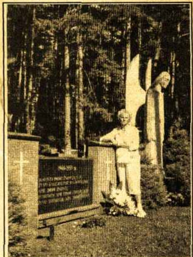
Kauno Petrašiūno kapinėse Lietuvos kančių memorialas 1940-41 ištremta apie 13,600 žmonių

Prisimenant tuos kankinius, kurie žuvo ir nesugrįžo į savo Tėviškes, pagerbkime atsistoję tylos minutę, kiekvienas paskendę savo asmeniškąje maldoje.