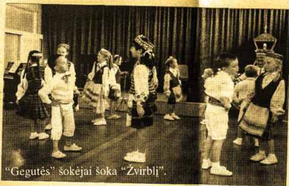
"Gegutės" šokėjai šoka "Žvirblį".

Sunku tikėti? Anot kun. Astijaus - ne, reikia TIK EITI. Ėjimas gerumu ir esti gyvenimas su Šventąja Dvasia.