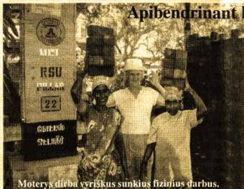
Moterys dirba vyriškus sunkius fizinius darbus.