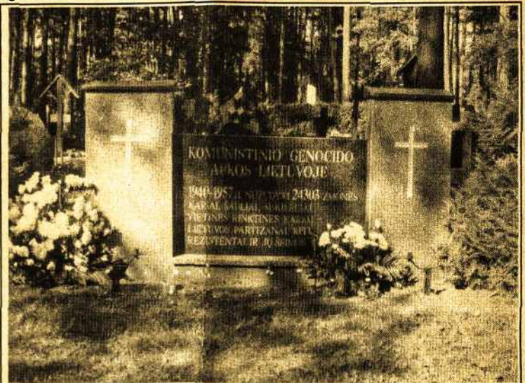
Paminklas Kauno Petrašiūno kapinėse Komunistinio Genocido aukos Lietuvoje, 1940-1957m. nužudyti 2430 žmonės kariai, šauliai, sukilėliai, vietinės rinktinės kariai, Lietuvos partizanai, kiti rezistentai ir jų šeimos.

garbingi žmonės, o sugrįžę pase tebenešioja "du kryželius" kas reiškia "tavęs reikia saugotis".