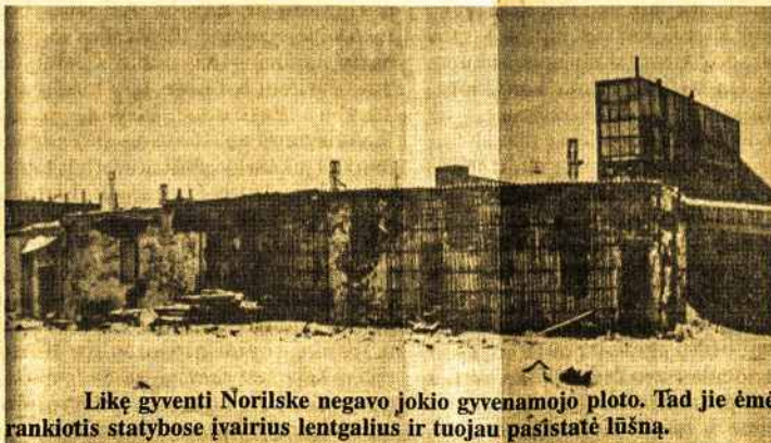
Likę gyventi Norilске negavo jokio gyvenamojo ploto. Tad jie ėmė rankiotis statybose įvairius lentgalius ir tuojau pasistatė lūšną.

Nors iš lagerio išleido, bet iš Norilsko dar nenori. Randu laikraštyje Ministrų Tarybos žinutę, kad leista susijungti šeimoms TSRS teritorijoje. Aš tą laikraštį parodau komendantui ir prašau, kad mane išleistų pas tėvą į Krasnojarsko kraštą, Ačinsko miestą. Man jis atsakė, kad mes sveikų žmonių iš Norilsko neturime teisės išleisti. Girdėjau iš sargybinių, kad jei į