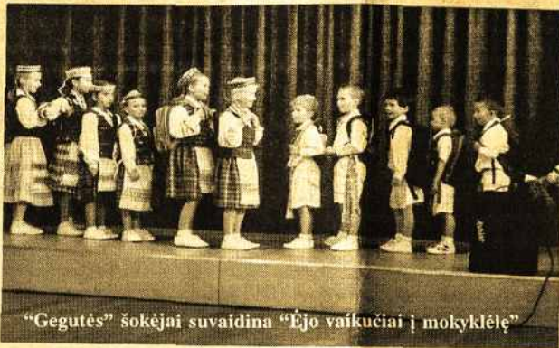
"Gegutės" šokėjai suvaidina "Ejo vaikučiai į mokyklėlę"