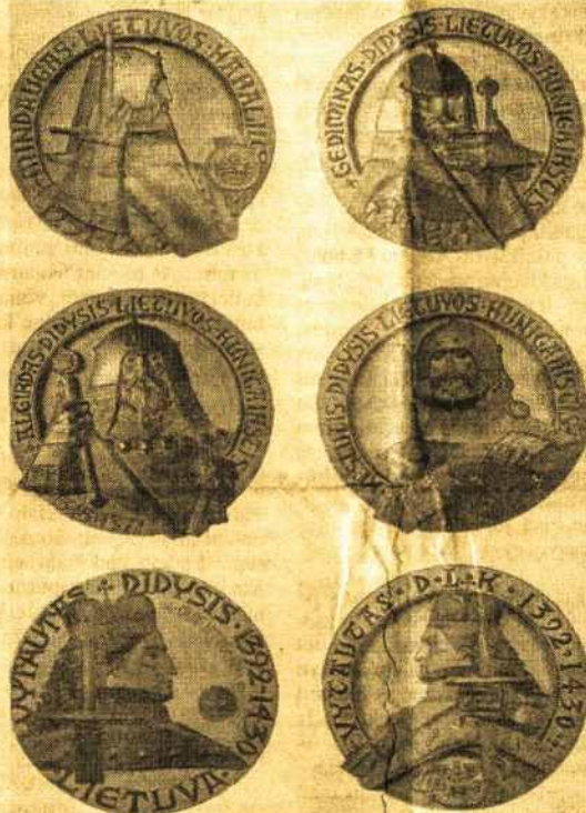
Skulptoriaus Vytauto Kašubos sukurti kunigaikščių atvaizdai.

Lietuvos Valstybės dienos (liepos 6 d.) proga - puoselėdami tautinę kultūrą, meilę savo tėviškei, kviečiame visus vadovautis tauriais Vinco Kudirkos Tautiškos giesmės žodžiais: „Iš praeities Tavo sūnūs te stiprybę semia“.