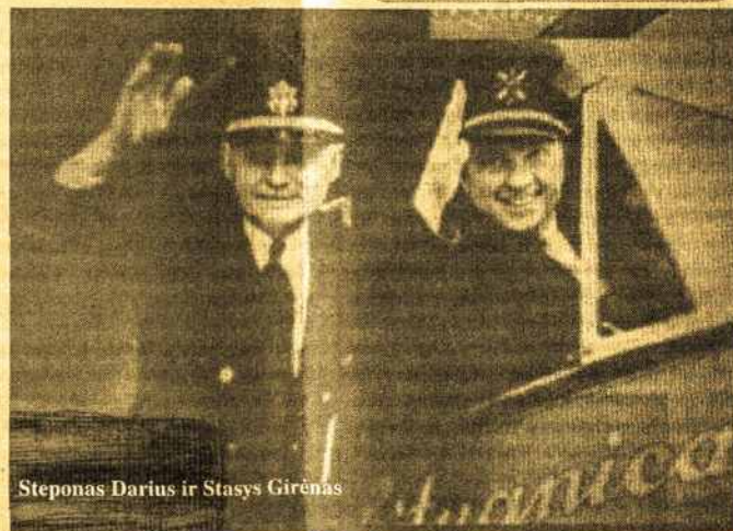
Steponas Darius ir Stasys Girėnas