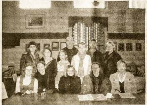
Tėvų ir vaikų būrelis su ALB Krašto Valdybos nariais Melburno Lietuvių Namuose aptaria programą.