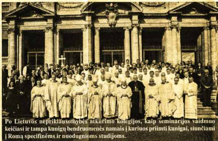
Po Lietuvos nepriklausomybės atkūrimo kolegijos, kaip seminarijos vaidmuo keičiasi ir tampa kunigų bendruomenės namais, kuriuos priimti kunigai, siunčiami į Romą specifinėms ir nuodugnoms studijoms.