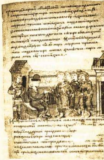
Radvilų metraščio miniatiūra, vaizduojanti tautas, XII a. pr. mokėjusias duoklę Rusiai. XV a.

Polocko kunigaikščiams kovojant tarpusavyje, lietuviai galėjo tikėtis atlygio už pagalbą vienai ar kitai jų grupei. Lietuviai teikė karinę