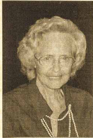
Kūčių vakare 2008 m.