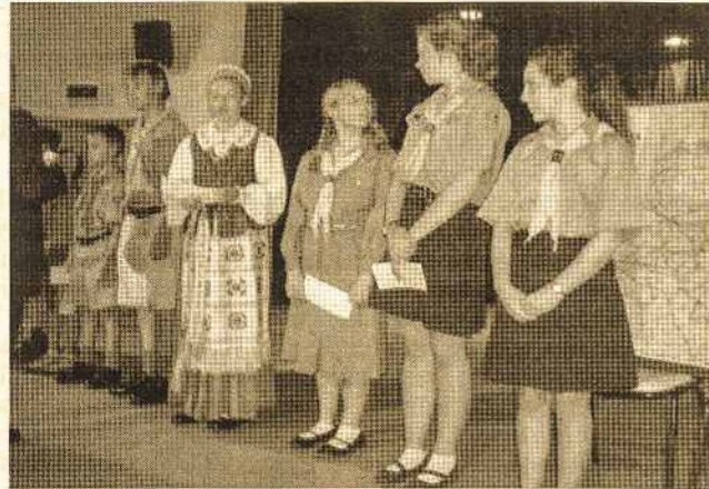
Melbourno jaunimas, ne tik rašinėlius siunčia į "Tėviškės Aidas", bet ir dalyvauja "Džiugo tunto" veikloje.

turi šie du žodžiai! Koks sudėtingas pasaulio lietuvių likimas! Ir vis tik kur mes bebūtume, ką beveiktume, svarbiausia mūsų vieta, kaip sako poetas Maironis: