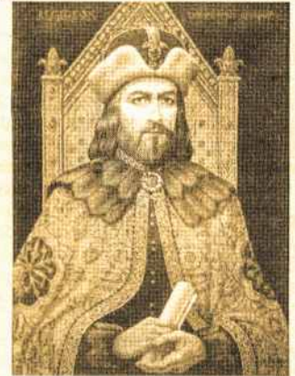
Algirdas. Dail. J. Malinauskaitė, 1988 m.

Kazimieras III Didysis užgrobė Liubarto valdytą Haličą, tarp Lietuvos ir Lenkijos prasidėjo ilgas karas dėl Volynės. 1366 m. Lenkija užėmė vakarinį Volynės pakraštį ir ilgainiui jame įsitvirtino, bet didžioji Volynės dalis liko Lietuvos valdžioje.