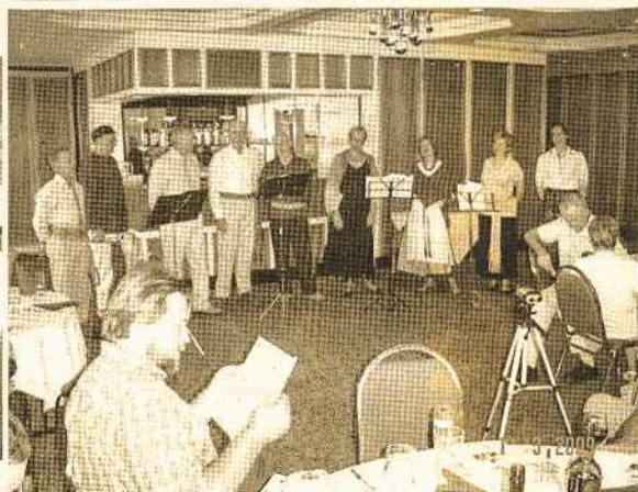
"Kaimas" dainininkai išpildo meninę programą.