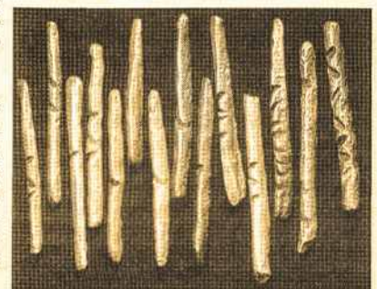
Lietuviški ilgieji - XIV a. Lietuvos pinigai LNM