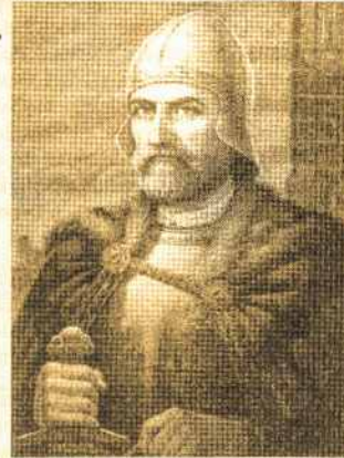
Kęstutis. Dail. J. Malinauskaitė, 1994 m.

1337 m. prie Nemuno kryžiuočiai pastatė Bajerburgą (Bavarijos pilį),