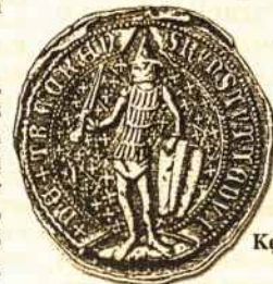
Kęstučio antspaudas (1379 m.)