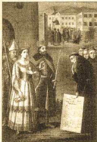
Šv. Jonas Kapistranas prieš Lietuvos didįjį kunigaikštį ir Lenkijos karalių Kazimierą Jogailaitį XIX a. LDM