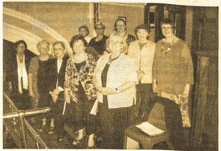
Danos sesės ir draugės dalyvavo ir gražiai pagiedojo St. Mary's Star of the Sea, West Melbourne bažnyčios koncerte kovo mėnesį. Dalyvavo daug lietuvių, nors buvo labai nepalankus laikas 18.30. DL

...Sportas... Lietuvos ledo ritulio rinktinė balandžio 14 d. Vilniuje, "Siemens" arenoje, vykstančiose varžybose sutriuškino australus 9:3 (5:0, 2:1, 2:2).