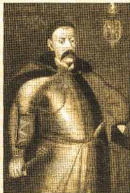
LDK didysis etmonas Mykolas Kazimieras Pacas. XVII a. antra pusė.

1673 m. Lenkijos ir Lietuvos valstybės seime Lietuvos atstovams pavyko išsireikalauti, kad kas trečias Seimas rinktųsi Lietuvos Didžiosios