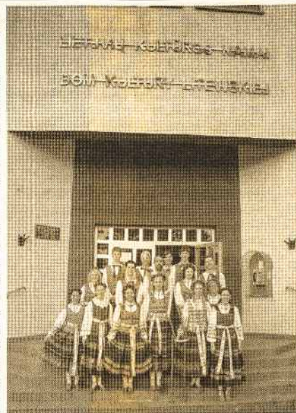
"Viktorijos" šokėjai po koncerto Punkso Lietuvių Kultūros Namuose (27.VI.09)

Buvome pakviesti pasmaguriant skaniais pyragais, šiltais pyragėliais, kuriuos iškepė darbščios Socialinės Globos Draugijos narės. Mes, klausytojai, nuoširdžiai dėkojame šioms šaunioms moterims už suruoštą įdomią popietę. Laukiame naujų susitikimų.