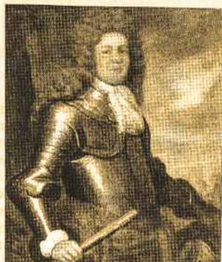
Lenkijos karalius ir Lietuvos didysis kunigaikštis Mykolas Kaributas Višnioveckis. XVII a. pab.

Tešinsys iš "Pažintis su Lietuva Tūkstantmečio knyga I".