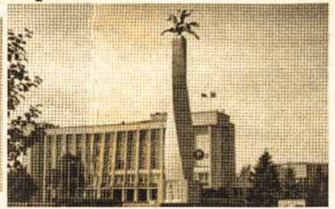
Marijampolėje iškilio paminklas lietuvių tautai, kalbai ir Lietuvos vardo paminėjimo tūkstantmečiui

Vienas paminklo kalbai ir tautai idėjos sumanytojų, Marijampolėje Seimo nariu tris kartus rinktas Algis Rimas LŽ sakė, kad tai - dalis jo rinkiminės programos.