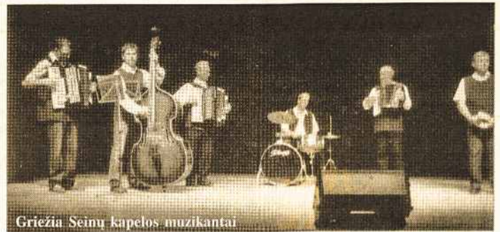
Griežia Seinų kapelos muzikantai

Labai nusivylėme, nes mūsų koncertas net nebuvo išreklamuotas. Reklamos buvo iš anksto išsiųstos iš Melbourne. Paklausus, kur yra reklamos, buvo atsakyta - namuose. Tik prieš pat koncertą pasirodė reklama, prie pastato. Žiūrovų buvo ne per daugiausia. Būtų buvus pilna salė, nes žmonės turi retą progą veltui pasižiūrėti koncertą, ypač