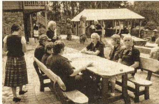
Kalbamės ir laukiame pietų Arklių muziejuje Anykščiuose...