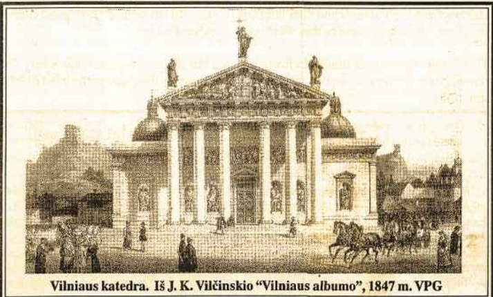
Vilniaus katedra. Iš J. K. Vilčinskio "Vilniaus albumo", 1847 m. VPG

Tekstas Ramunės Šmigelskytės (Bus daugiau)