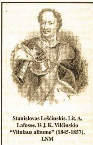
Stanislovas Leščinskis. Lit. A. Lafosse. Iš J. K. Vilčinskio "Vilniaus albumo" (1845-1857). LNM

1717 m. Varšuvoje įvykusiame Nebylijame seime (Seime vyko prižiūrint rusų kariuomenei tik vieną dieną, neleista diskutuoti) buvo patvirtintas valdovo ir konfederatų susitarimas: Augustas II privalėjo išvesti saksų kariuomenę, o bajorija atsisakė teisės organizuoti konfederacijas. Buvo apribota etmonų valdžia, karių skaičiaus sumažintas iki 24 tūkst. (LDK iki 6 tūkst.), apribota bajorų seimelių kompetencija, palikta liberum veto teisė. Nebyliojo seimo konstitucijos garantu tapo Petras I. Prasidėjo atviras Rusijos kišimasis į Lenkijos ir Lietuvos valstybės vidaus reikalus.