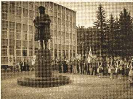
Jonavojė Santarvės aikštėje buvo atidengtas paminklas vienam iš lietuvių raštijos pradininkų Abraomui Kulviečiui, iškiliam XVI amžiaus šviesuoliui.