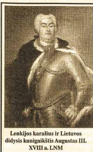
Lenkijos karalius ir Lietuvos didysis kunigaikštis Augustas III. XVIII a. LNM

1734-1763 m. - Augusto III valdymo laikotarpis. Šis valdovas buvo vienintelis Augusto II ir Kristijonos Eberhardinos iš Hohencolernų sūnus. Ruošdamasis tapti Respublikos valdovu, 1712 m. jis persikriktijo iš protestantų į katalikus. 1719 m. vedė imperatoriaus Juozapo I dukterį Mariją. Tapęs valdovu Augustas III stengėsi tęsti savo tėvo vykdytą Respublikos ir