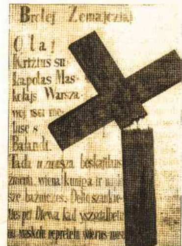
1863 m. sukilimo plakatas. LNM