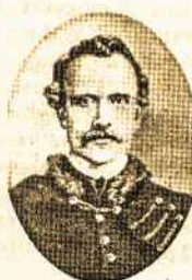
Vienas iš 1863 m. sukilimo vadų Zigmantas Sierakauskas XIX a. 7 dešimtmetis. LNM.