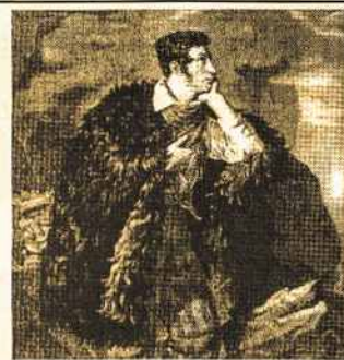
Adomas Mickevičius ant Ajudago kalno.