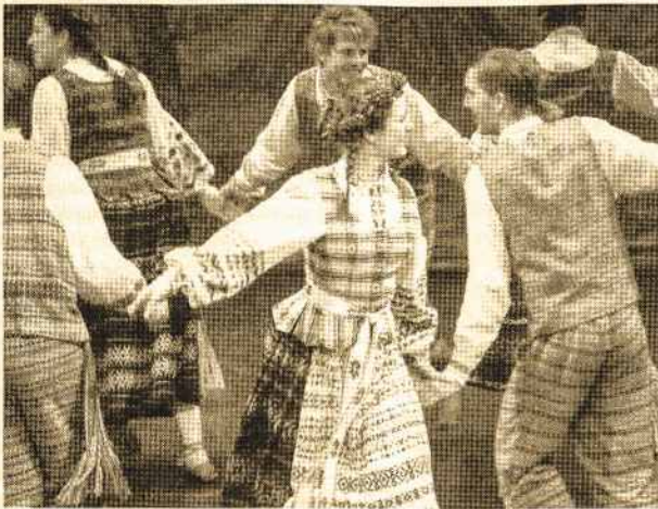
“Gintaro” tautinių šokių grupė