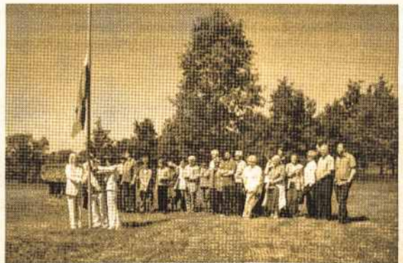
2008 m. tarptautinio seminaro „Ažuolas Lietuvoje ir Europoje“ dalyviai vėliavos pakėlimo ceremonijoje Ažuolyną.

1) Stepulis V. Tautos ažuolynas, Vilnius, 2009, p. 12. 2) Ten pat, p. 13. 3) Ten pat, p. 12-20.