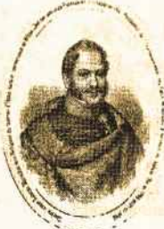
1831 m. sukilėlių komiteto pirmininkas, vyriausiasis kariuomenės vadas Lietuvoje Karolis Zaluskis.