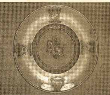
"MLS" trispalvė, viršuje jungtinė šyda - nr. 1341