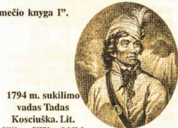
1794 m. sukilimo vadas Tadas Kosciuszka. Lit. Villan. XIX a. LNM

Gegužės 3 d. Konstitucijoje išdėstytas unitarinės valstybės modelis nepatenkino LDK atstovų siekių išlaikyti Lietuvos atskirumą nuo Lenkijos, tačiau LDK deputatai reformų šalininkai (LDK artilerijos generolo Kazimiero Nestoro Sapiegos grupuotė Seime), suprastdami būtinybę stiprinti valstybę bei matydami grėsmę jos egzistavimui, parėmė Konstituciją.