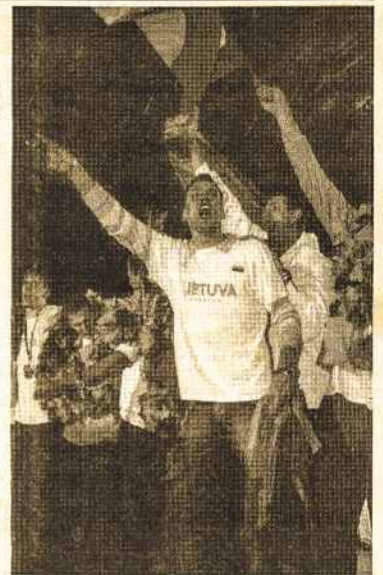
Oak wreaths adorn the 2007 European basketball championship bronze medal winners.

Oak wreaths are used to bestow honour on deserving individuals at various national events, usually sports champions.