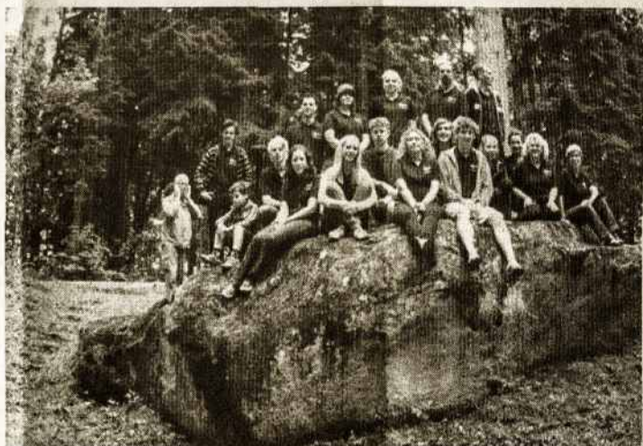
Australian Lithuanian Folk Dancing Group at Devils Rock, near Zarasai in June 2009