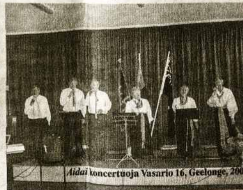
Aidai koncertuoja Vasario 16, Geelonge, 2007