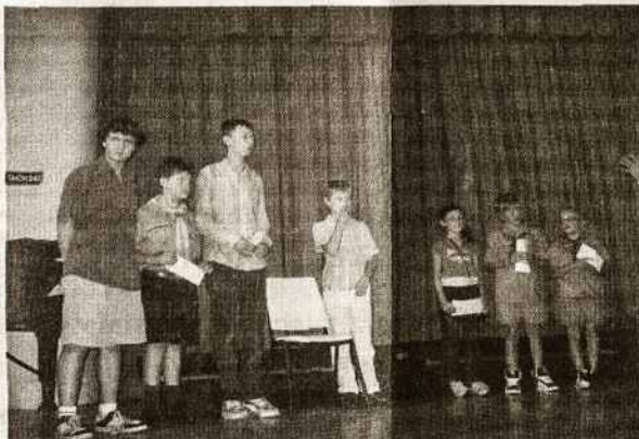
"Tėviškės Aidai" - "Spindulėlio" jauniems rašytojams buvo įteikti Australijos Lietuvių Fondo paskatinimo premijas.

Parapijietė, B. Prašmutaitės nuotraukos.