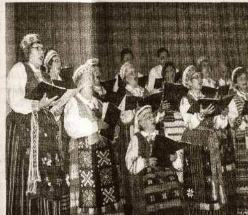
"Dainos Sambūrio" choro dalis.