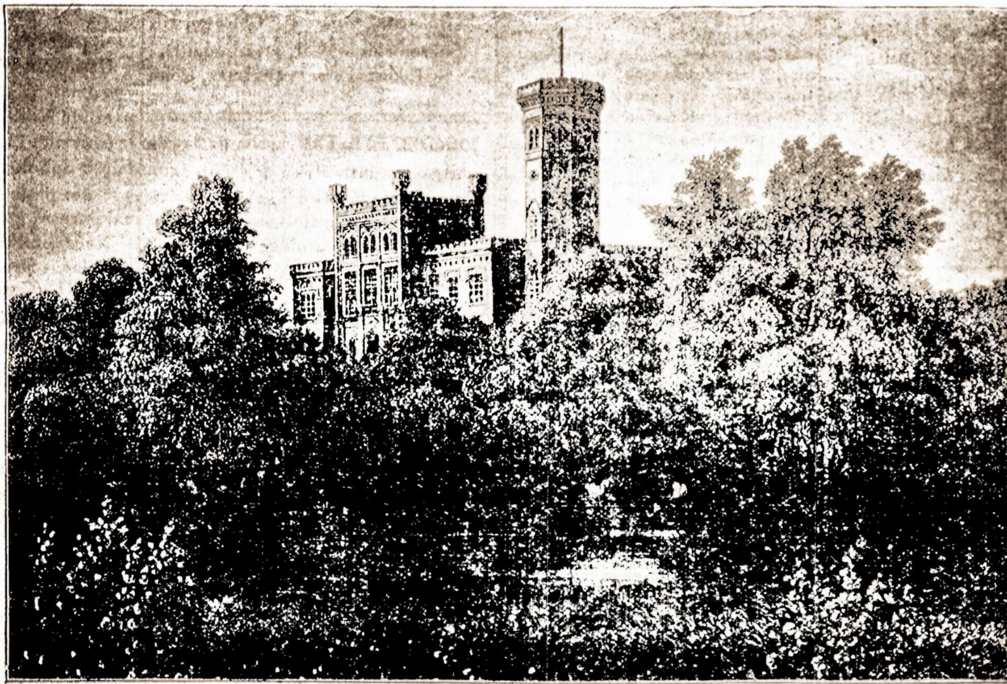
Vez — Auzė (Kursze.)

Tolesnės nuo pylių žiamės, padalintos į didesnius ar mažesnius dvarus, tapė vokiečiams (žinoma ritteriškos luomos) į lėną duotos, kurie turėjo stoti į kariumenę, nešti naštą kariškos blėdies, iš nelaisvės iš-įpirkti; o burai jų dvaro buvo pilniugai pavesti jų galybei, turėjo jų klausyti ir mokėti čjžę